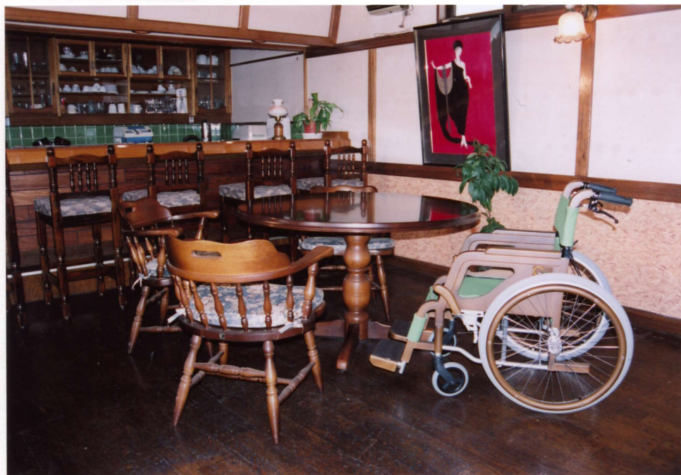
W303-RW-G 木製車椅子グリーン