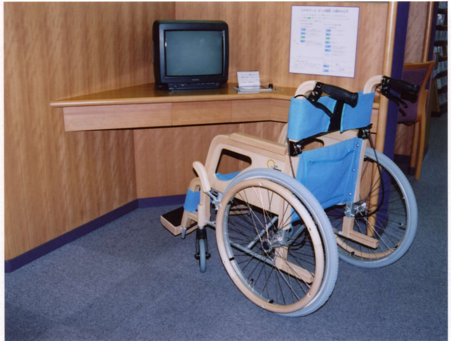
W303-NC-B 木製車椅子ブルー