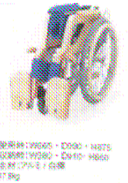
W303-RW-G 木製車椅子グリーン W303-NC-P 木製車椅子ピンク W303-NC-B 木製車椅子ブルー