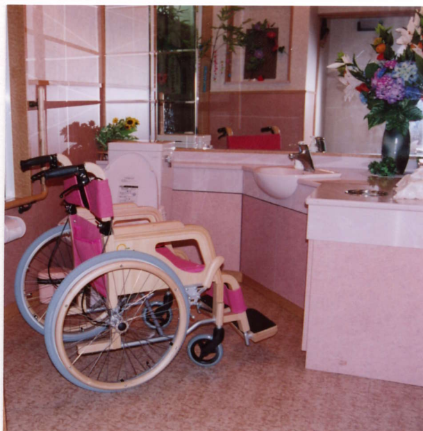
W303-NC-P 木製車椅子ピンク